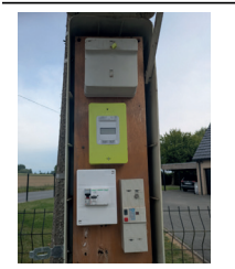
Armoires NON CONFORMES