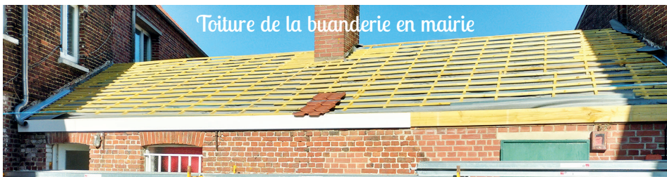
Toiture de la buanderie en mairie