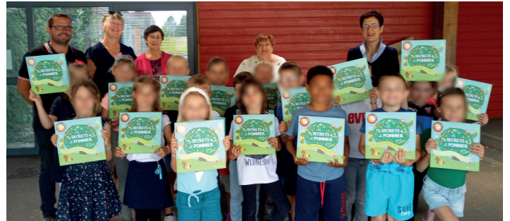
La distribution des prix s'est faite de classe en classe

Maire : Véronique BOIDIN : 06 74 08 53 23