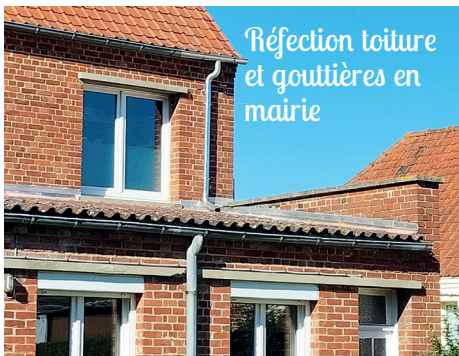
Réfection toiture et gouttières en mairie