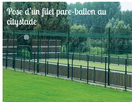
Pose d'un filet pare-ballon au citystade