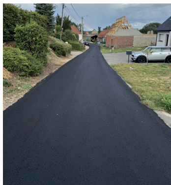
RUE DE LIGNE