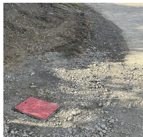
BOUCHE INCENDIE RUE DE COCHENDAL

Dans le cadre de l'amélioration de la défense incendie, des travaux ont été réalisés ces dernières semaines avec l'installation de plusieurs bouches et poteaux d'incendie sur le territoire communal. Ces équipements permettront de renforcer l'efficacité des services de secours et d'assurer une meilleure protection des personnes et des biens. La municipalité remercie les habitants pour leur compréhension durant la période des travaux.