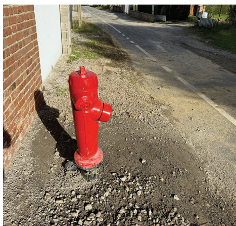
DECI RUE DE COCHENDAL