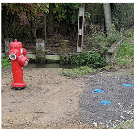
DECI RUE BLONDEL